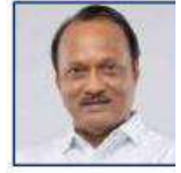
محترم اجیت جی پوار نائب وزیر اعلیٰ ریاست مہاراشٹر