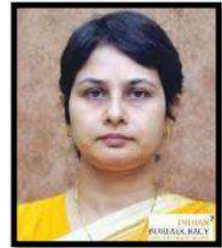
محترمہ وندنا کرشنا (IAS) چیف ایڈیشنل سیکریٹری شعبہ اسکولی تعلیمی و کھیل ریاست مہاراشٹر