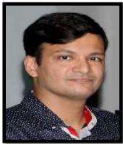
محترم وشال سو لکنی (IAS) کمشنر (تعلیم) ریاست مہاراشٹر