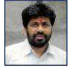
محترم اوم پرکاش عرف پچو باراؤ کڈو راجیہ منتری شعبہ اسکولی تعلیم ریاست مہاراشٹر