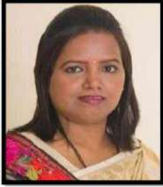
پروفیسر ورشٹائی گائیگاڈ وزیر برائے اسکولی تعلیم ریاست مہاراشٹر