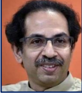
मा.ना.उद्धवजी ठाकरे मुख्यमंत्री महाराष्ट्रराज्य