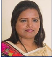
प्रा.वर्षा गायकवाड मंत्री शालेय शिक्षण विभाग महाराष्ट्र राज्य