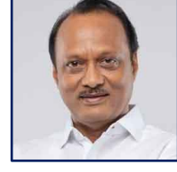
मा.ना.अजित पवार उपमुख्यमंत्री महाराष्ट्रराज्य